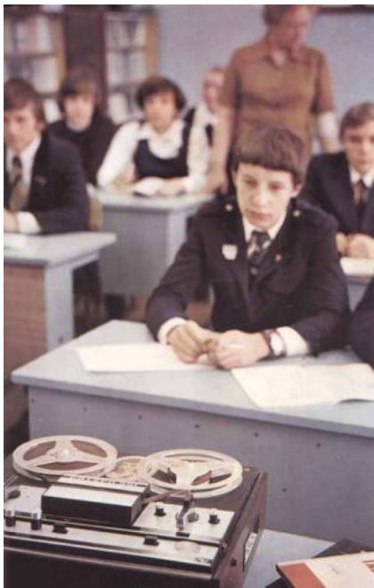
Тоталитаризм СССР проявлялся в том, что тотально все дети были вынуждены ходить в школу.