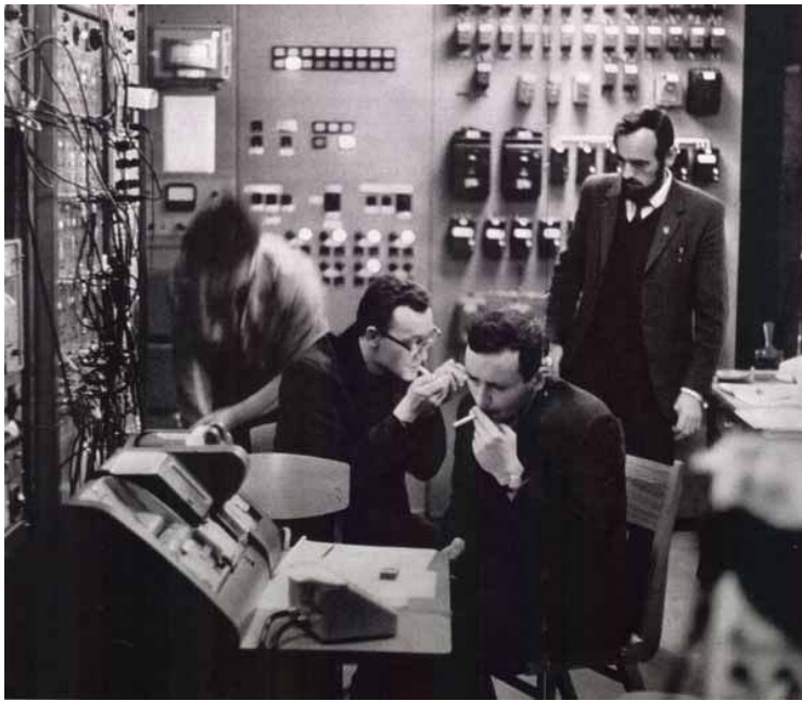
Советские инженеры нервно курят. Еще бы - они отстали от цивилизованного мира на сто лет. Но, к счастью, их документы уже лежат в ОВИР-е и скоро они вольются в счастливую семью западных народов.