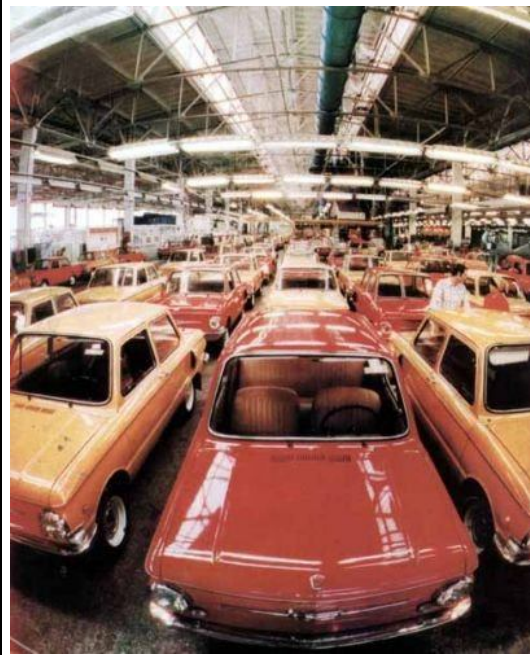
Советские горе-машины. Некомпетентные советские руководители считали почему-то, что наличие своего отечественного автопрома - это признак высокоразвитого индустриального государства.