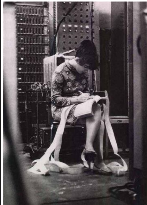
А в хорошее время, при Ельцине и Путине, ты, девушка-красавица, сможешь стать проституткой, а не жить мучительной серой совковой жизнью!