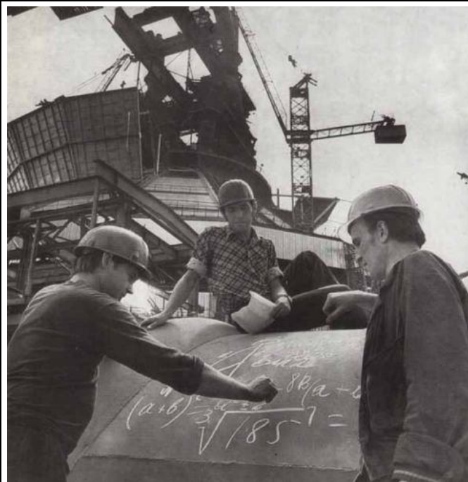
Советские рабочие делают вид, что знают алгебру! На самом деле рабочий умел считать только до трех шестидесяти двух.