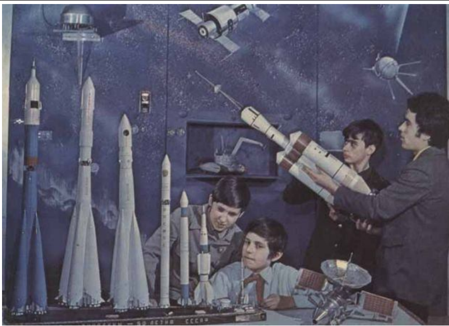
Модели ракет, в которых только до Гагарина погибло 28 (или 48) оставшихся неизвестными космонавта-смертника.