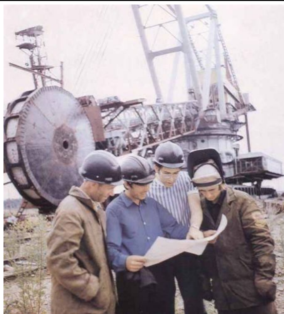
Изможденные люди с помощью примитивной техники непосильным трудом добывают из-под земли полезные ископаемые - чтобы секретари горкомов и обкомов КПСС тратили миллионы долларов в Биаррице, Куриавеле и Ницце!