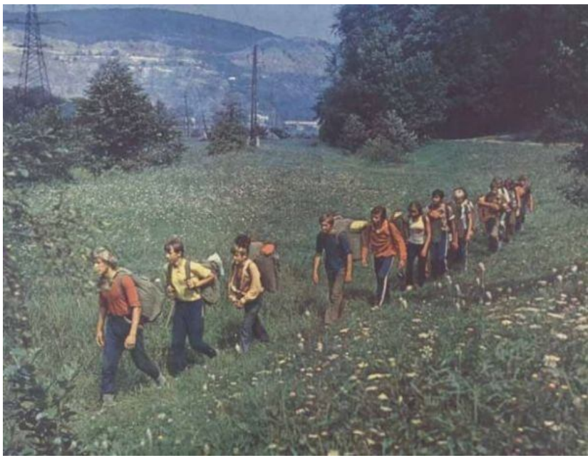
Готовиться к войне - вот все, что нужно было советской молодежи. И ее мучали турпоходами и спортом. И не выпускали "клинское"!