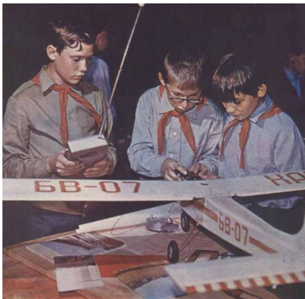
Это не кружок моделистов-конструкторов! Это советские дети тренируются на моделях атаковать небоскребы в Америке.