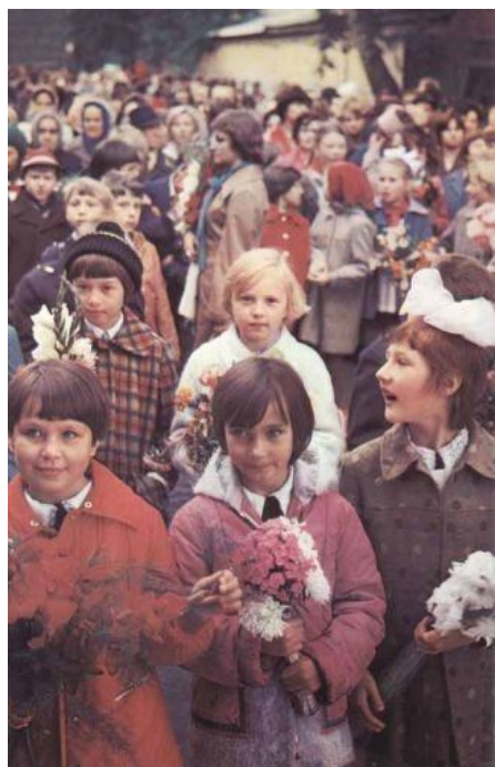
1 сентября в дом каждого советского человека приходила страшная беда. Беда говорила: "Учиться, учиться и учиться!"