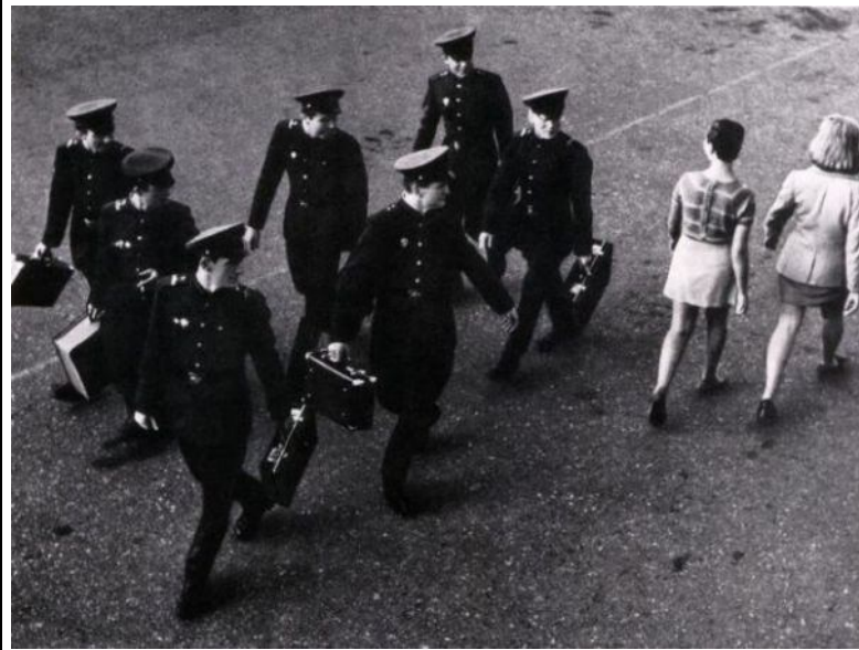
В СССР секса нет! Вы разве не знали - это же было в передаче Познера.