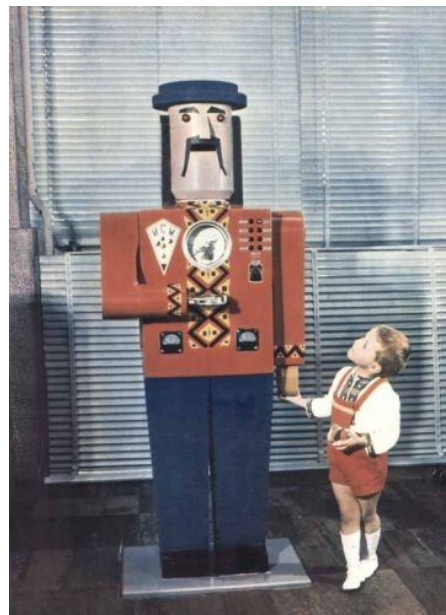
Наверное, вот такими роботами хотели бы видеть коммунисты в Москве украинский народ, не до конца истребленный голодомором!