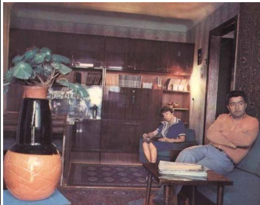
Убогий быт внутри.