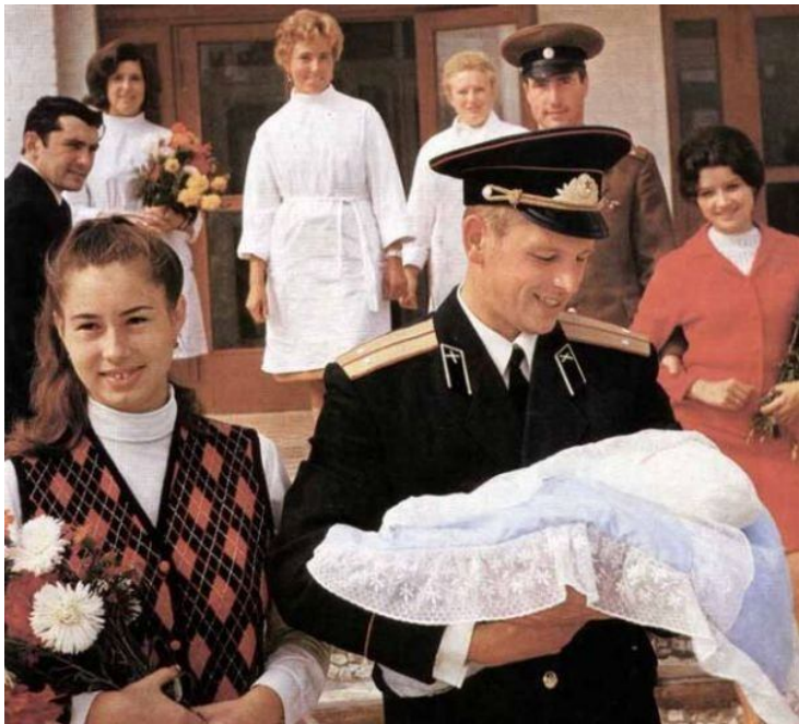
Серые лица советских рабочих - и сравните их с одухотворенными лицами участников передачи "Дом-2" и других молодежных программ российских телеканалов!