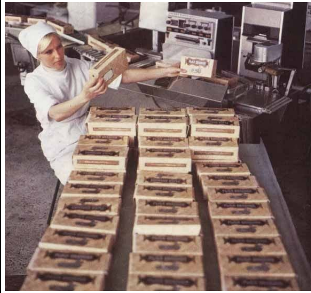
Пока советские шоколадные фабрики не были приватизированы или куплены западными компаниями, там делали только соевые плитки.