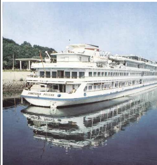
Такие близкие каждому россиянину слова "Единая Россия" не нравились богомерзким коммунистам. Только Советская!