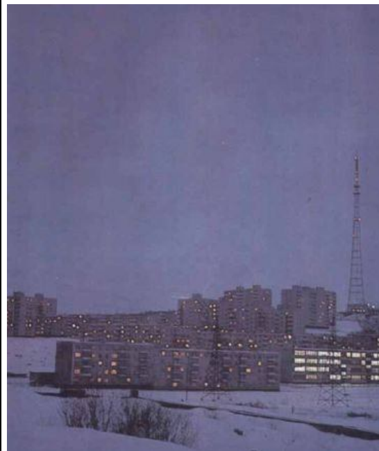
Это картонные декорации города на Севере. За щитами с нарисованными домами - бараки лагерей.