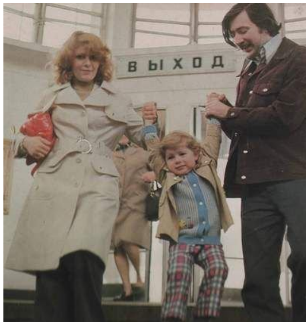
Вот еще один будущий оккупант Афганистана и стукач КГБ!