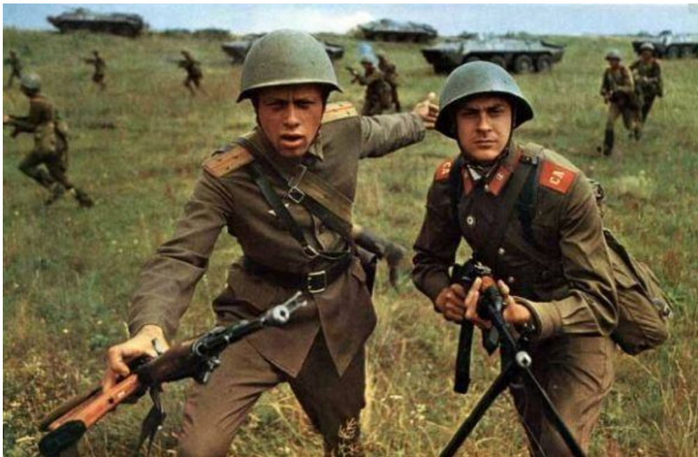
Kill "em all! Убивай всех! - кричит советский офицер солдату. И он будет убивать. От Белграда до Багдада.