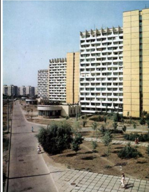
В СССР не было ипотеки. Поэтому люди жили в бараках и землянках. А эти дома строились для видимости. Потом их сносили - и на их месте выкапывались землянки.