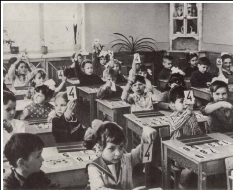
"Сколько лет нужно дать диссиденту Щаранскому?" "4!" - отвечают оболваненные советской пропагандой первоклассники.