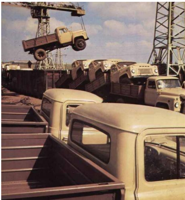
Советские грузовики исключительно для перевозки "груза 200".