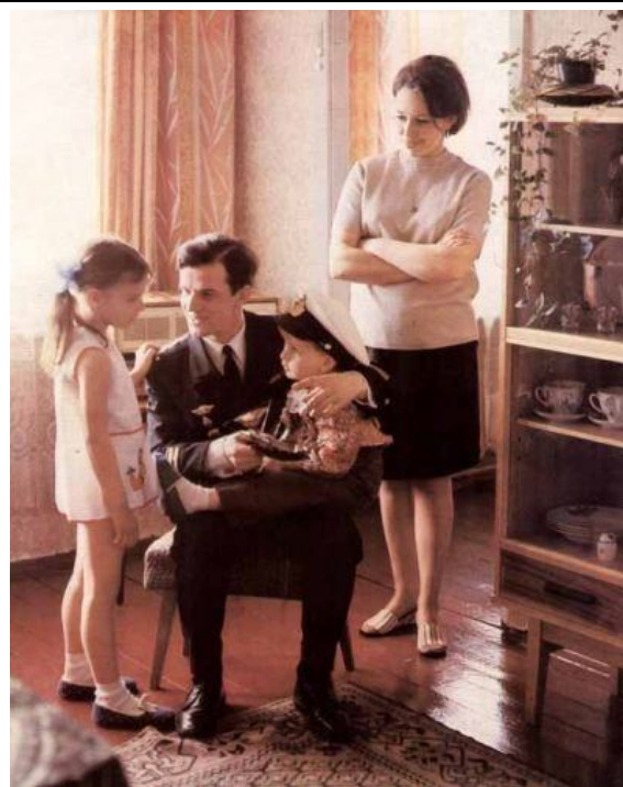
Вот он, хищный оскал советского милитаризма!