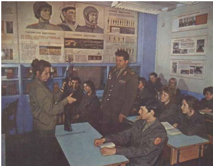
Коммунисты демагогически говорили о том, что каждый должен уметь защищать Родину с оружием в руках. Только потом мы узнали, что Родину должны защищать солдаты-контрактники.