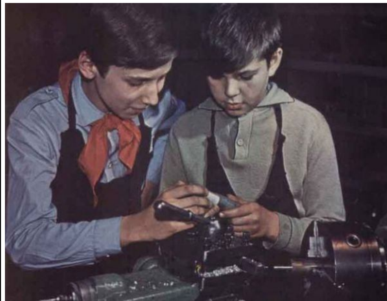
Детей (!) приучали к Трудю! Нарушая их право нюхать клей в подвалах или учить Слово Божье на уроках ОПК!