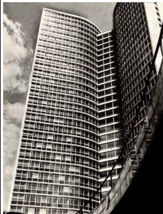
Уродливые дома, в тени которых прошла несчастная жизнь горожан.