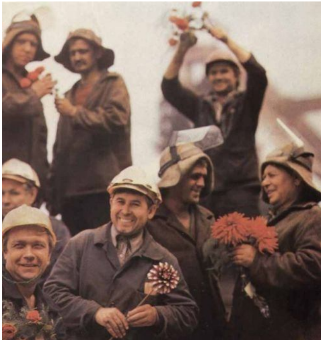
Якобы рабочие якобы радуются якобы досрочному якобы выполнению якобы плана.