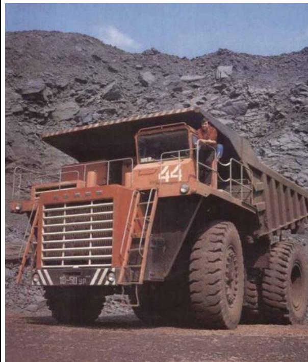
Зачем делать машины в своей стране - когда их можно было покупать в ФРГ?