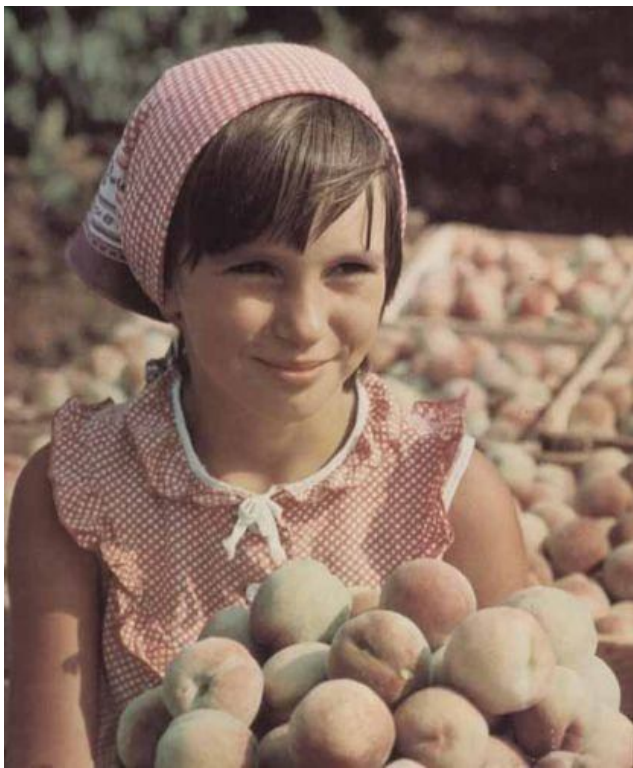
Страшный снимок из советского ада.